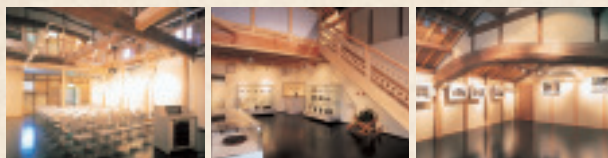
■ 1F 多目的ギャラリー (面積104.30㎡) ■ 1F 展示室1 (面積50.98㎡) ■ 2F 展示室2 (面積29.40㎡)

明治時代の米蔵を改装しており、はり等の部材には 当時の材木をそのまま生かして使用しています。